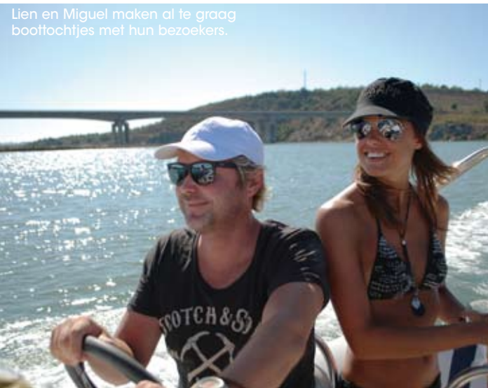
Lien en Miguel maken al te graag boottochtjes met hun bezoekers.