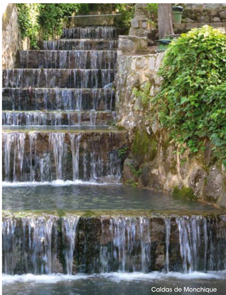
Caldas de Monchique